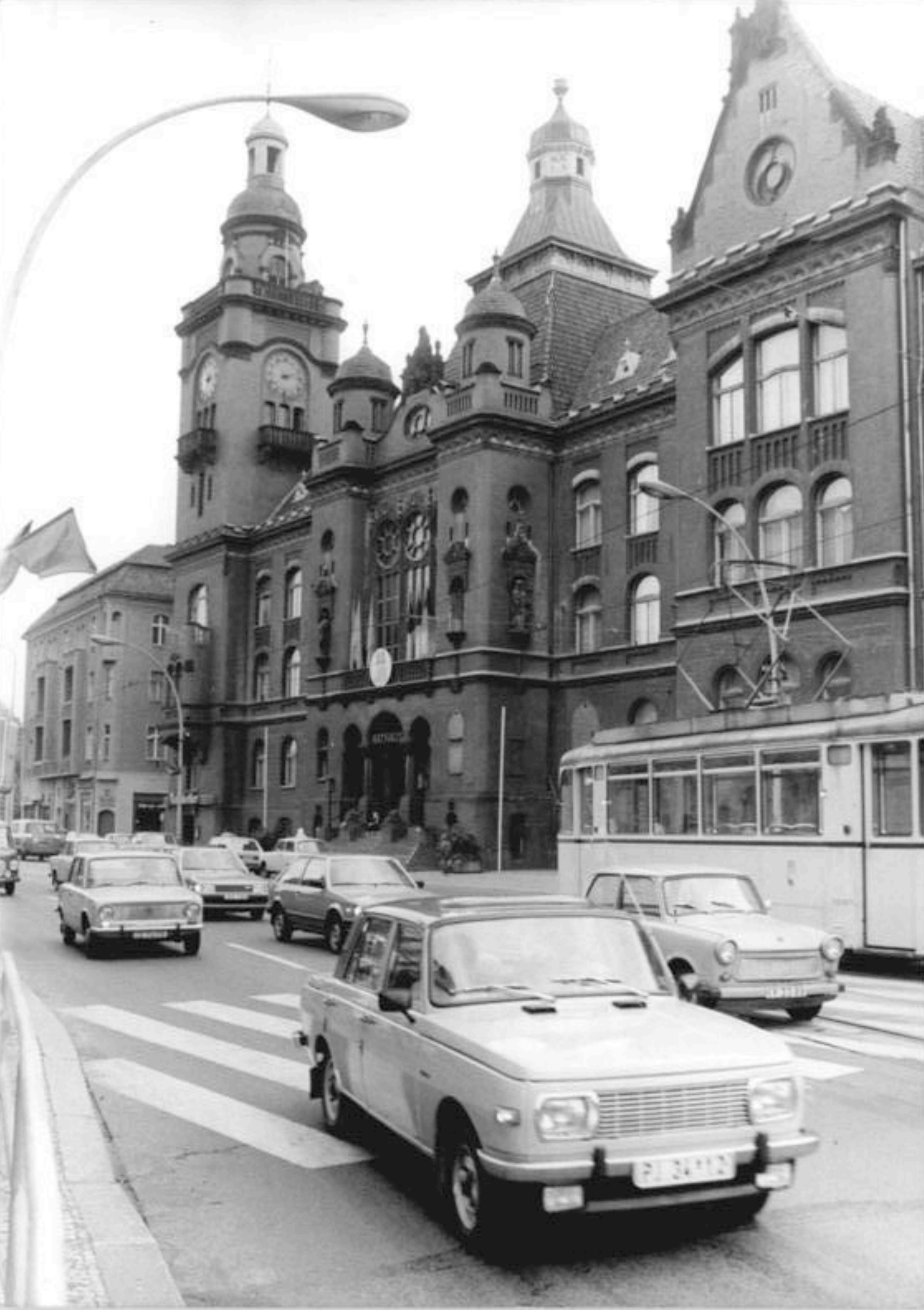
Oktober 1984