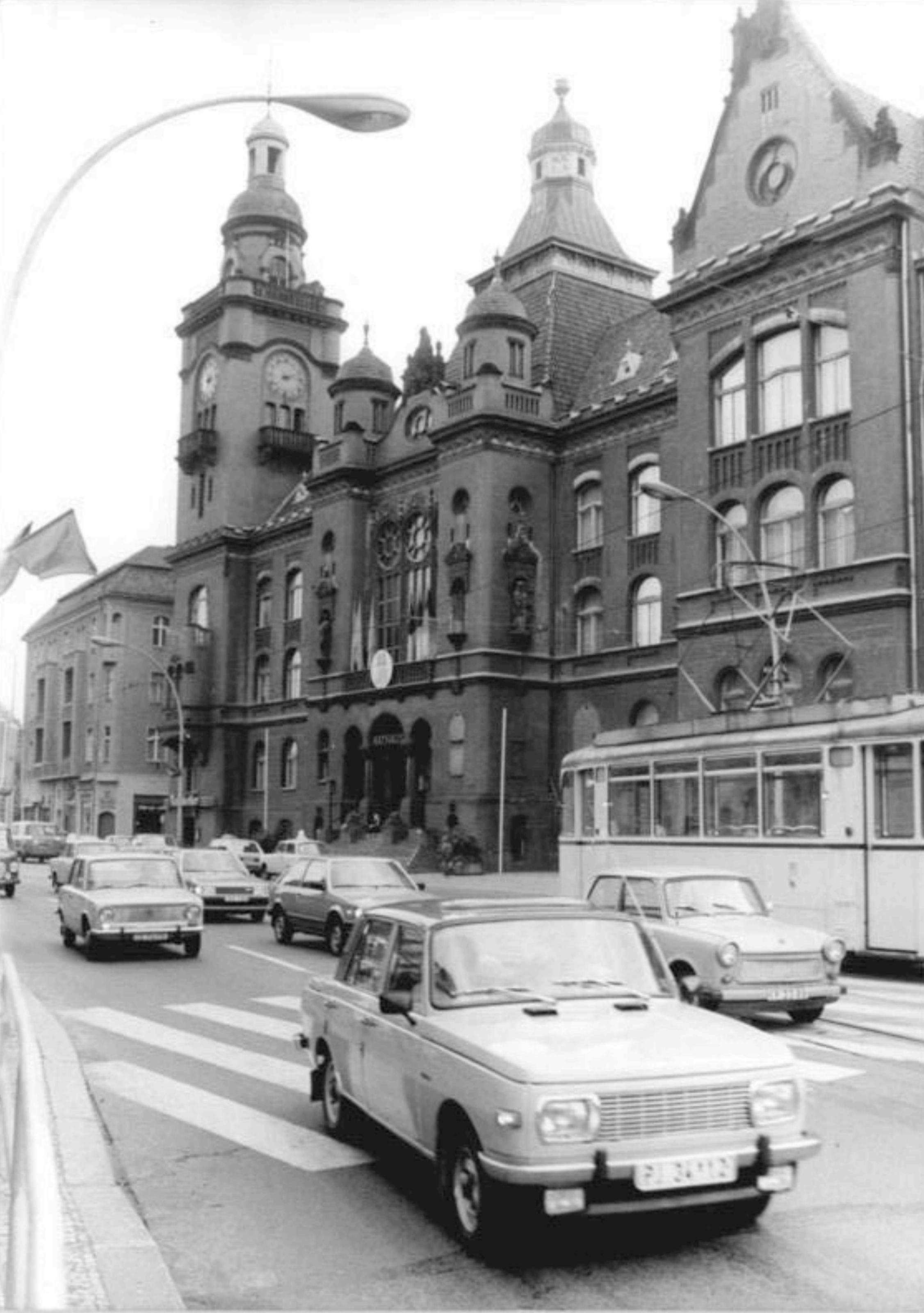
Oktober 1984